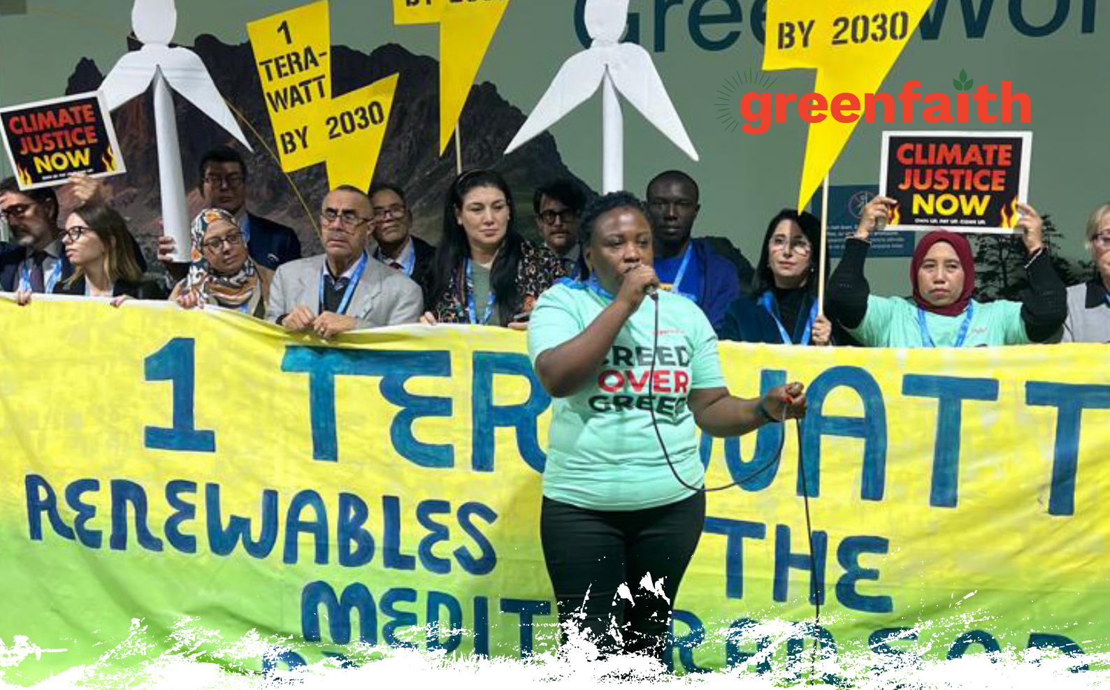
Religionsvertreter*innen auf der COP29 fordern eine schnelle Verbreitung sauberer Energie