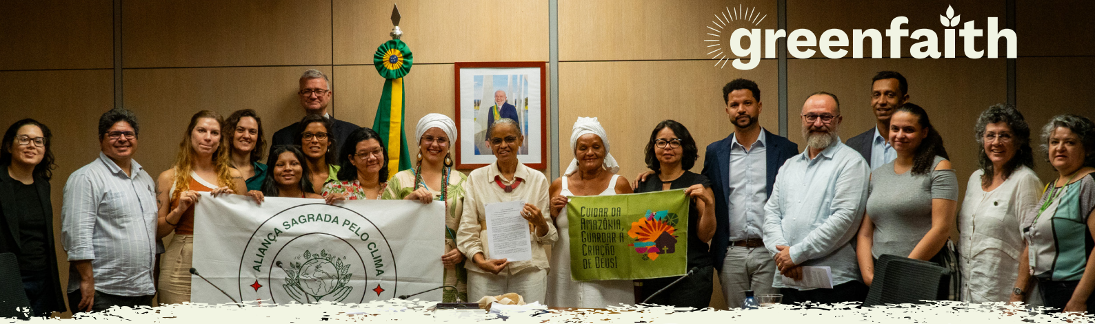
Das Team von GreenFaith Brasilien und weitere Kolleg*innen treffen sich mit der brasilianischen Umweltministerin Marina Silva