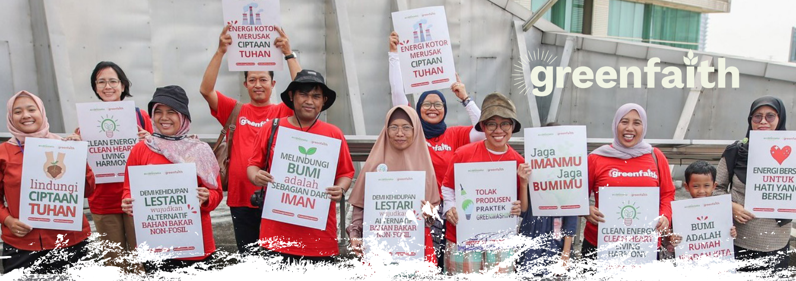
Religiöse Leitungspersonen unterstützen saubere Energie