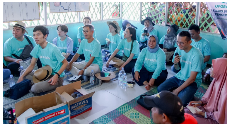
Japanische und indonesische Leitungspersonen verschiedener Religionen beim Besuch eines von Japan finanzierten Kohlekraftwerks in Indonesien

Japans größte Energiequelle ist Kohle, der schmutzigste fossile Brennstoff. GreenFaith versammelte religiöse Führungspersönlichkeiten, um sich mit japanischen Parlamentsmitgliedern zu treffen und für einen Ausstieg aus der Kohle und einen Aufschwung der erneuerbaren Energien zu werben. Wir regten auch japanische religiöse Jugendleiter*innen dazu an, ein von Japan finanziertes Kohlekraftwerk in Indonesien zu besuchen und sich mit kommunalen Vertreter*innen, indonesischen Parlamentarier*innen und religiösen Führungspersönlichkeiten zu treffen, die gegen das Kraftwerk sind. "Dies war eine neue und augenöffnende Erfahrung für mich", schrieb ein Teilnehmer, der in den japanischen religiösen Medien über die Reise berichtete. „Diese Erfahrung hat mich davon überzeugt, wie wichtig es ist, an einer Mission zu arbeiten, die uns von Gott anvertraut wurde, und in der Gesellschaft Zeugnis abzulegen.“ Durch diese Maßnahmen baut GreenFaith überregionale, multireligiöse Solidarität und Zusammenarbeit auf.