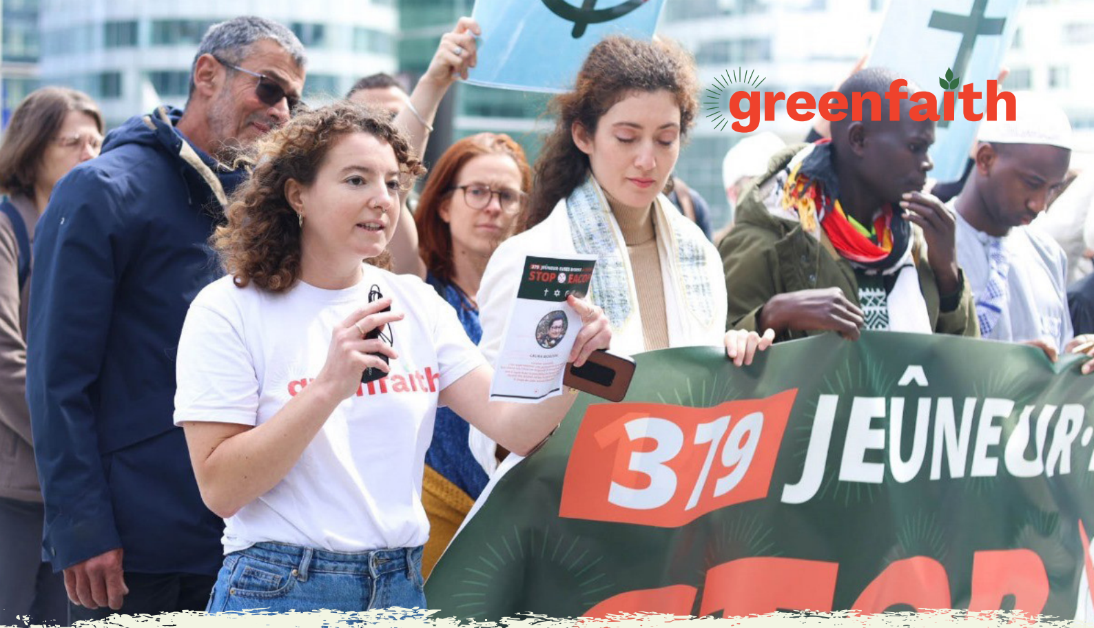
Multireligiöse Aktivist*innen widersetzen sich EACOP auf der Aktionärsversammlung von TotalEnergies