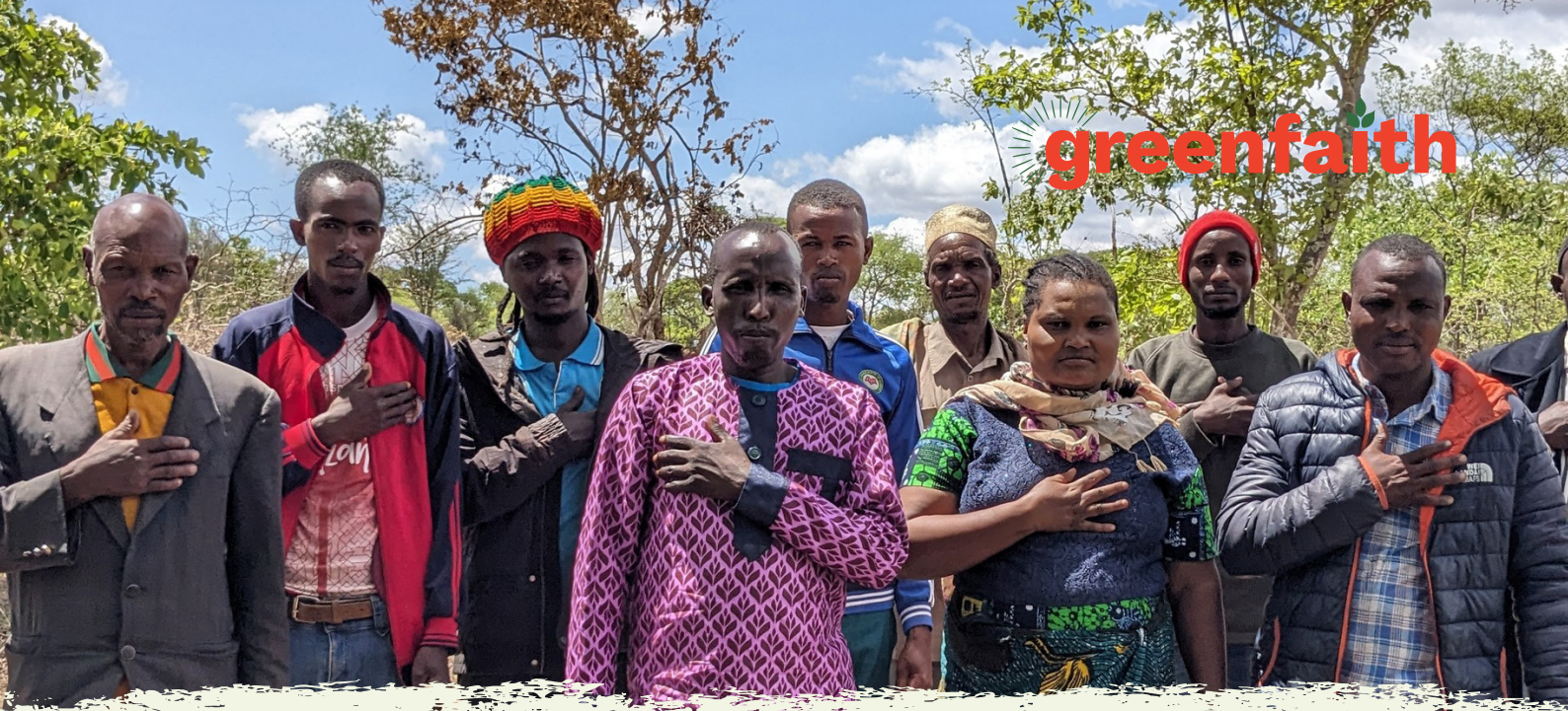
Die Leiter*innen des GreenFaith Tansania Circles verpflichten sich zum Widerstand gegen EACOP