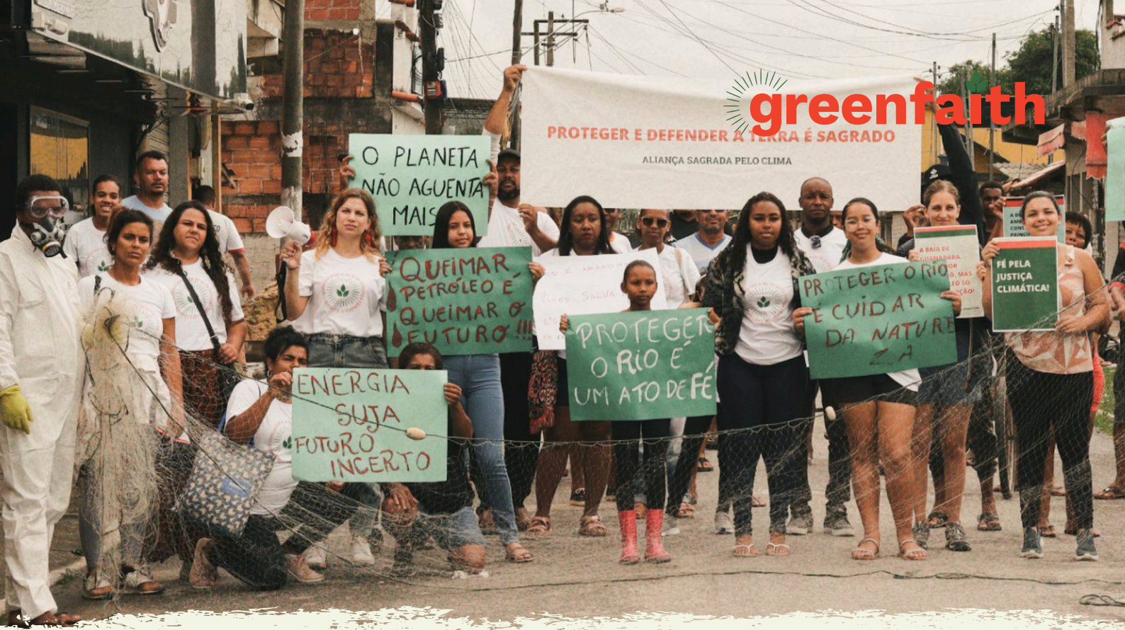
Brasilianische GreenFaith Aktivist*innen versammeln sich zum Schutz und zur Verteidigung der Erde