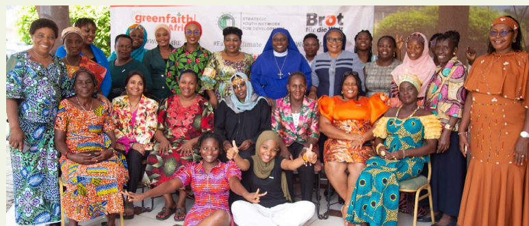
Versammlung von Frauen unterschiedlichen Glaubens mit GreenFaith Ghana

Ein Höhepunkt des Jahres war die Zusammenkunft von 35 führenden Frauen aus sechs afrikanischen Ländern. Diese christlichen und muslimischen Frauen setzen sich gemeinsam mit ihren Schwestern aus den traditionellen afrikanischen Religionen für saubere Energie ein und erzählten, wie sie mit den Auswirkungen des Klimawandels zu kämpfen haben. „Wenn wir in Solidarität zusammenkommen, sind wir bessere Fürsprecherinnen“, sagte eine Teilnehmerin.