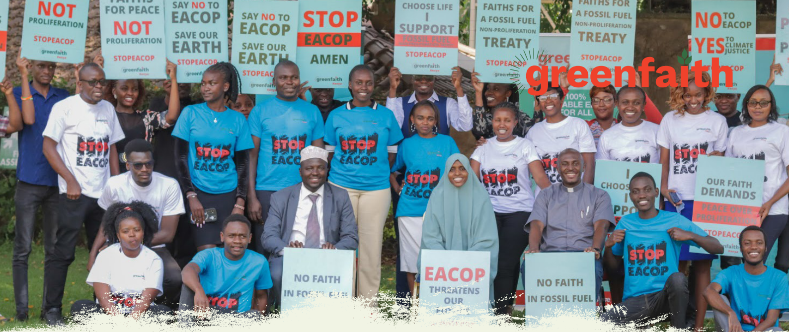
Multireligiöse Leitende aus Kenia fordern einen Vertrag zur Nichtverbreitung fossiler Brennstoffe