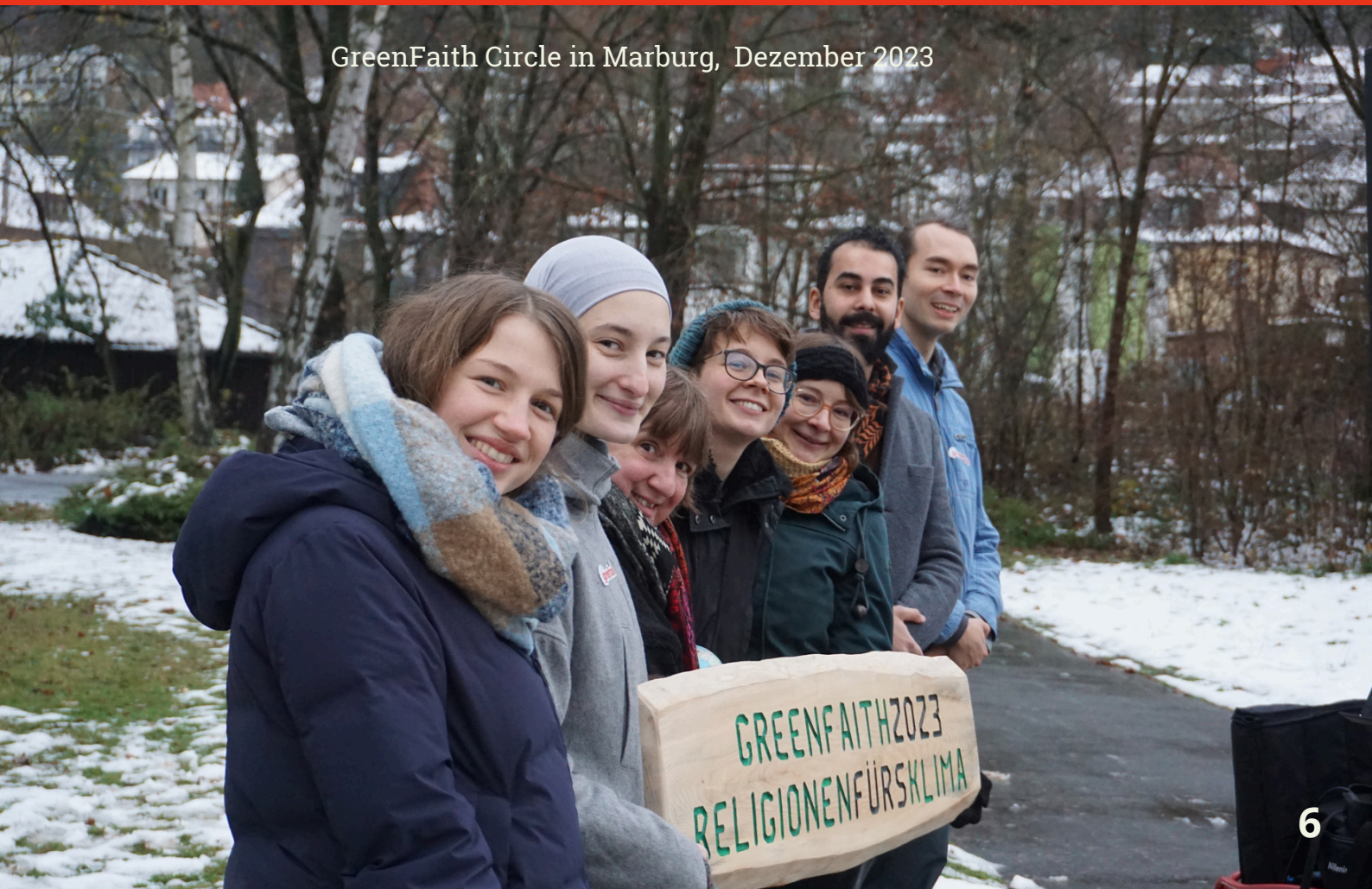
GreenFaith Circle in Marburg, Dezember 2023

“Ich habe mich sehr gefreut, 2023 einen GreenFaith Circle in Marburg gegründet zu haben. Wir haben gemeinsam mit Vertreter:innen der jüdischen, muslimischen, christlichen und der Bahai-Gemeinde einen Baum im Marburger Schülerpark gepflanzt. Vorbereitet wurde die Veranstaltung vom Marburger GreenFaith Circle. Wir haben den Baum im Dezember gepflanzt, und ein paar Monate später konnten wir schon die ersten frühlinghaften Blüten und Blätter sehen. Der Baum steht symbolisch für den wachsenden Einsatz von Religionen für mehr Klimagerechtigkeit.”