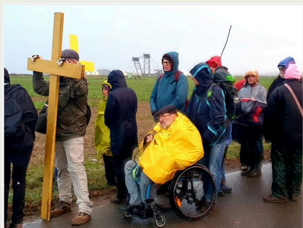
Prozession von KiDi in Lützerath.

„Die Hauptursache für den Klimanotstand sind fossile Brennstoffe“, betont Meryne Warah, globale Organisationsdirektorin von GreenFaith mit Sitz in Nairobi, in der Stellungnahme . „Um des Lebens Willen und um massives, graues Leid zu verhindern, brauchen Afrika und die ganze Welt ein verbindliches Abkommen, das neue Projekte für fossile Brennstoffe stoppt, die bestehende Produktion auslaufen lässt und großzügige Unterstützung für den Übergang zu einer sauberen Energiezukunft und den allgemeinen.“ Zugang zu sauberer, zugänglicher Energie bietet.“